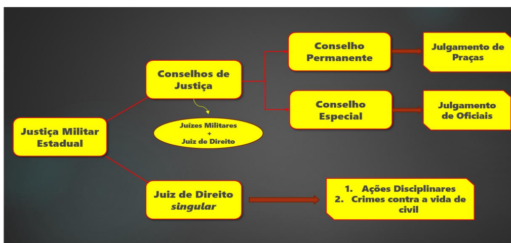
Imagem 02: Funcionamento da Auditoria Militar Maranhão.

Fez-se necessário a análise individual dos julgamentos realizados em cada processo para que se filtrasse o relativo somente aos Conselhos de Justiça (em detrimento da análise dos ato decisórios do Juiz Togado de forma singular) para, posteriormente, se extrair a informação sobre julgamentos em desfavor de praças e oficiais.