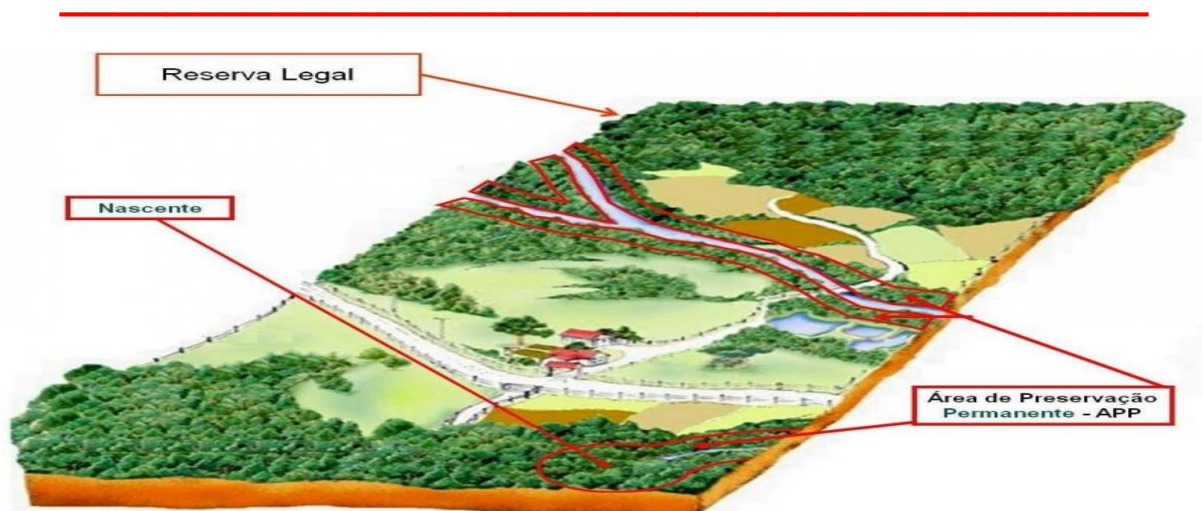
Figura 04: Conexão entre RL e APP