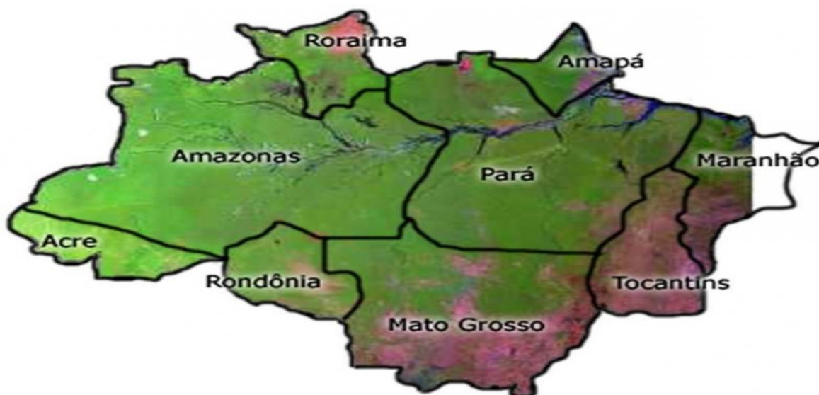
Figura 03: Amazônia Legal brasileira

Eis o mapa ilustrativo da Amazônia Legal brasileira: