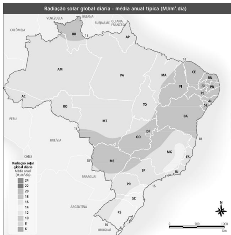
Figura 2: Radiação solar diária – Média anual típica, Fonte: Atlas Solarimétrico do Brasil. Recife; Editora Universitária da UFPE, 2000 (adaptado).