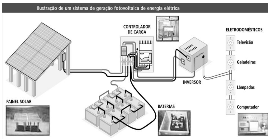
Figura 4: Ilustração de um sistema de geração fotovoltaica de energia elétrica de crédito e compensação energética.