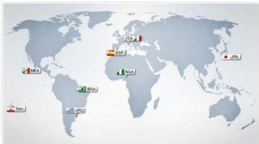
IMAGEM 2. Países que participaram da Copa das Confederações no Brasil em 2013