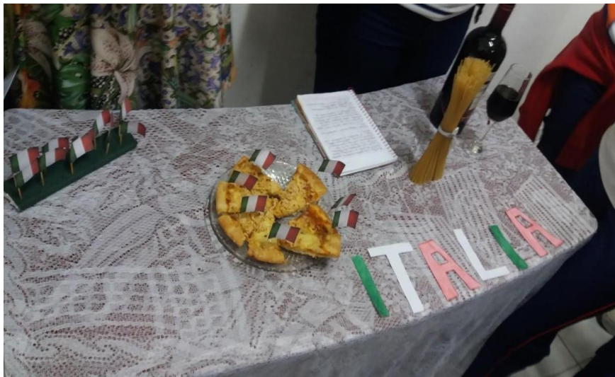
IMAGEM 05. Gastronomia da Itália